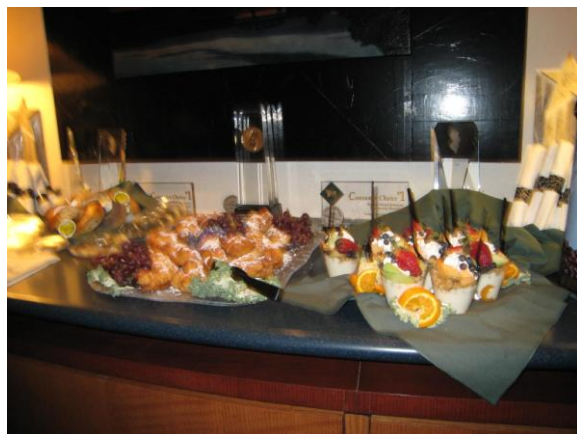
米国の経営品質賞(MB賞)をとったロバートウッズ病院では、我々の到着を待って、理事会が豪華な朝食を用意してくれていた。