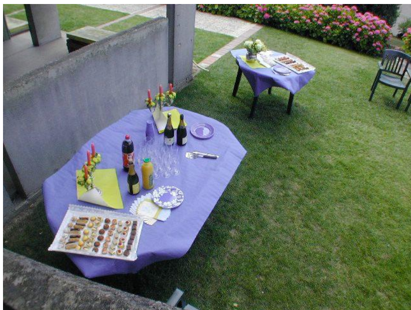
フランスの慢性病院ではゲストが来ると、コックさんが素敵なガーデンパーティを用意してくれる